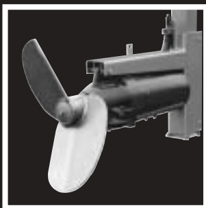
Miscelatori serie CMR CMR series mixers Mélangeurs série CMR