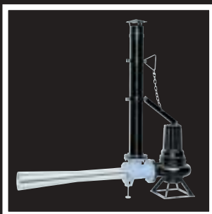
Ossigenatori OXY-FLOW OXY-FLOW Aeration Assemblies Groupes d'aération OXY-FLOW