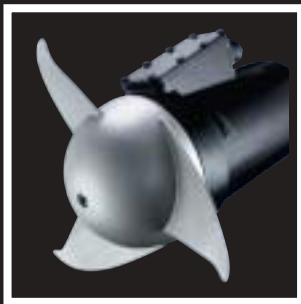
Miscelatori serie CMD CMD series mixers Mélangeurs série CMD